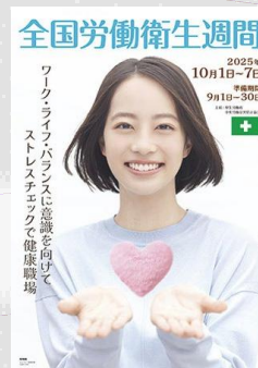
令和7年度全国労働衛生週間リーフレット

全国労働衛生週間は、労働者の健康管理や職場環境の改善等の労働衛生に関する国民の意識を高めるとともに、職場での自主的な活動を促して労働者の健康の確保等を図ることを目的として、昭和25年から実施されており、本年で76回を迎えます。 10月1日から10月7日までを本週間とし、スローガンは「ワーク・ライフ・バランスに意識を向けて ストレスチェックで健康職場」です。 期間中は ・熱中症の予防対策 ・化学物質による健康障害予防対策 ・現場における腰痛予防対策 ・石綿による健康障害防止対策 ・女性の健康課題の理解促進 等を積極的に進めてまいります。 高齢労働者をはじめとした労働者の健康管理、長時間労働による健康障害の防止対策やメンタルヘルス対策をサポートする仕組みを整備してまいります。また石綿障害予防規則などの関係法令に基づく取り組みの徹底を図るとともに、各事業場におけるリスクアセスメントとその結果に基づくリスク低減対策の実施を促進してまいります。