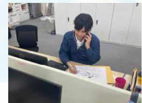
岡山営業所の様子

安全と品質向上に向けて、お客様ともパートナーともコミュニケーションを密にし、安心して施工日を迎えられるよう、より良い準備を日々心掛けております。