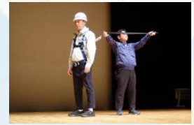
施工パートナー会発表