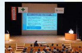
石綿作業について