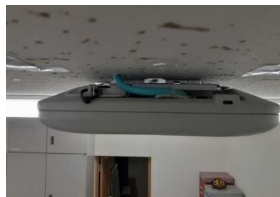
ベースとAP装置の固定