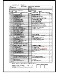
社内品質検査 チェックリスト