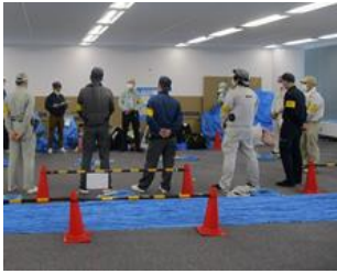
距離をとりながらの TBM/KY