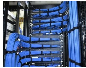
UTPケーブル整線検査

今後も厳しい目で社内検査を実施し、お客様にご満足頂けるNSK品質を作り上げてまいります。