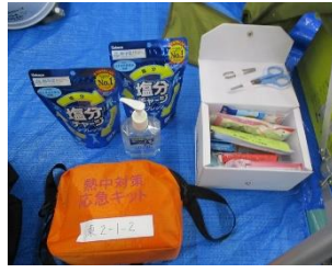
救急箱 熱中症キット 消毒ジェル 塩アメを配備