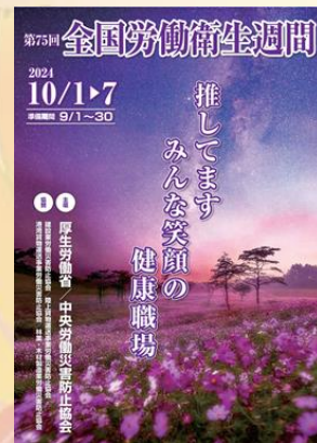
令和6年度全国労働週間リーフレット

高齢労働者をはじめとした労働者の健康管理、長時間労働による健康障害の防止対策やメンタルヘルス対策をサポートする仕組みを整備していきます。また石綿障害予防規則などの関係法令に基づく取り組みの徹底を図るとともに、各事業場におけるリスクアセスメントとその結果に基づくリスク低減対策の実施を促進してまいります。